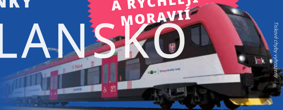
Tiskové chyby vyhrazeny